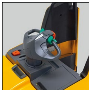
Puesto de trabajo confortable